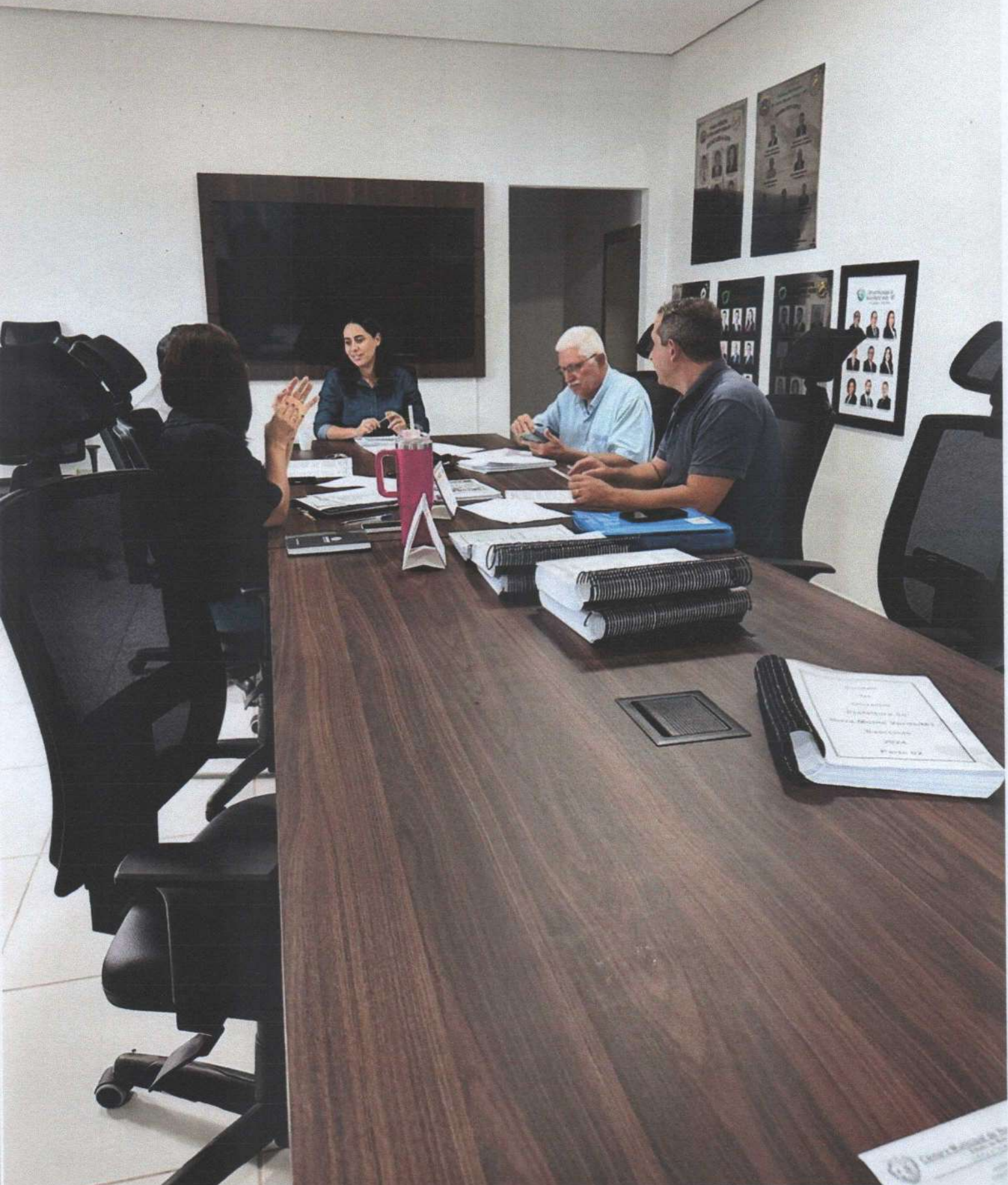
09.02.2026 - DISCUSSÃO DAS CONTAS DE GOVERNO XV 2024.