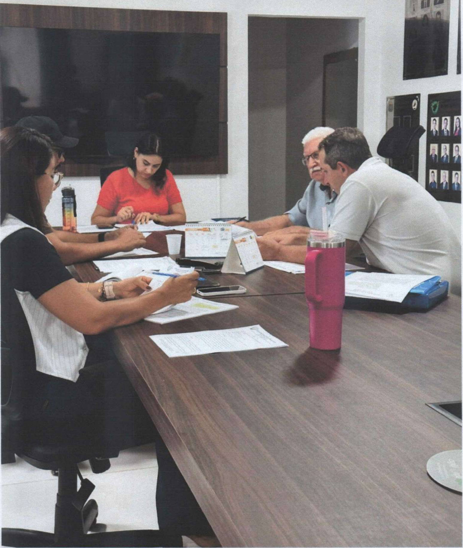
23-02-2026 - REUNIAO COM DEMAIS VEREADORES

CÂMARA MUNIC. N.M.V. - MT Fls. 09 Rub. [Signature]