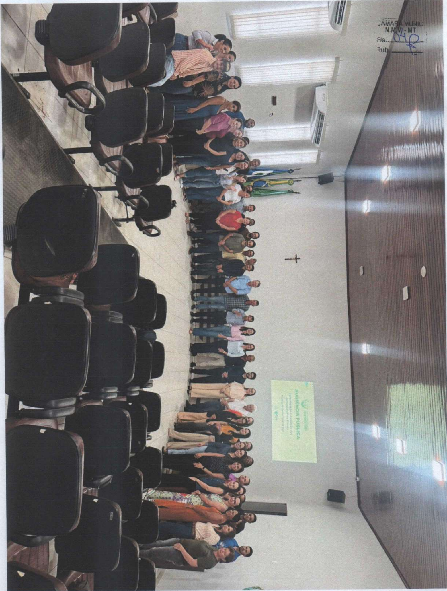
27-02-2026 - Audiencia Pública

JAMAFRA MUNIC N.M.V. - MT Fls. 010 Rub. 1