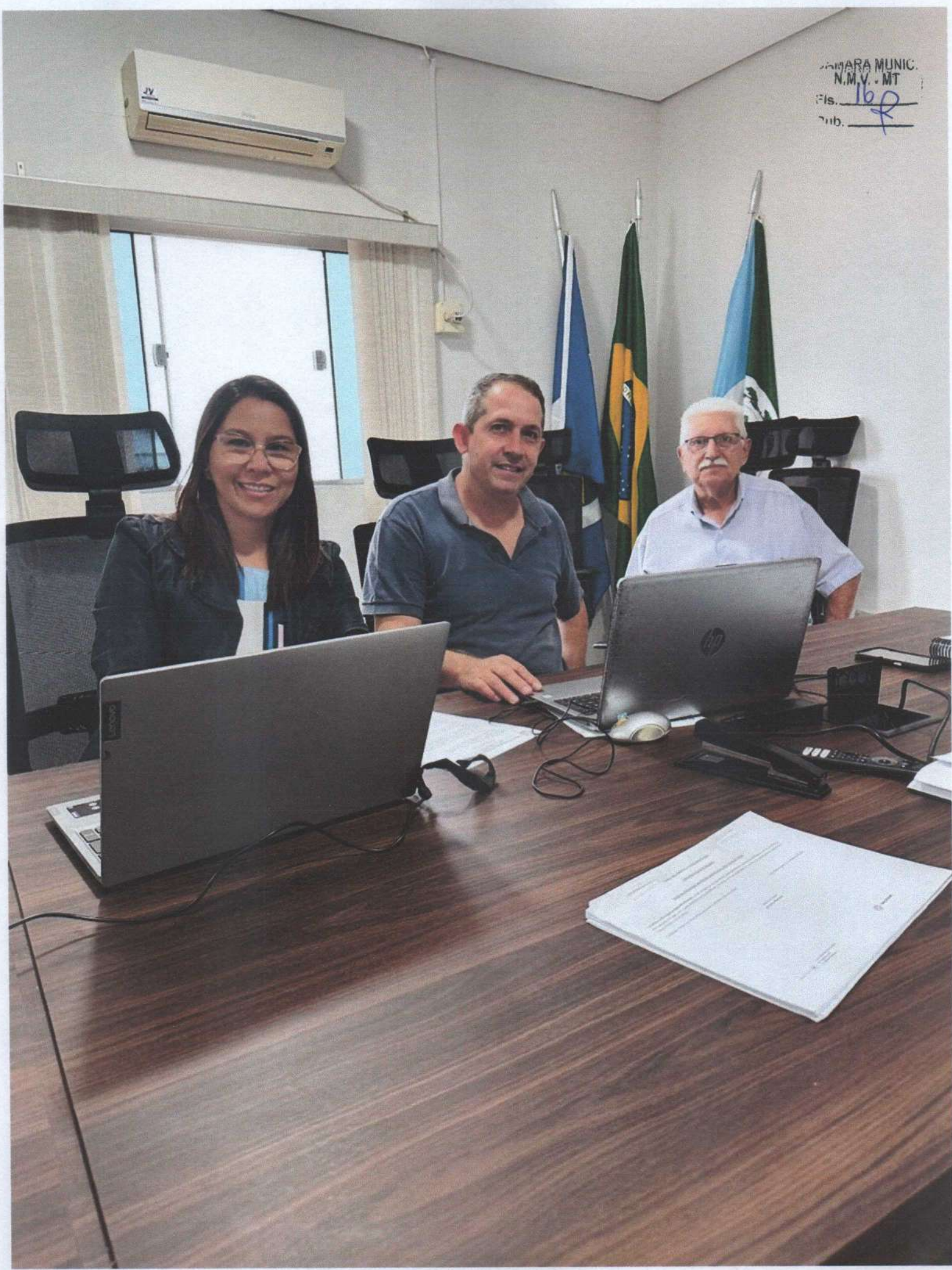
10-02-2026 - COMISSÃO DE REDAÇÃO FIDAL - PAROCELA PROJETOS.

MUNIC. N.M.V. - MT Fis. 169 Rub. [Signature]